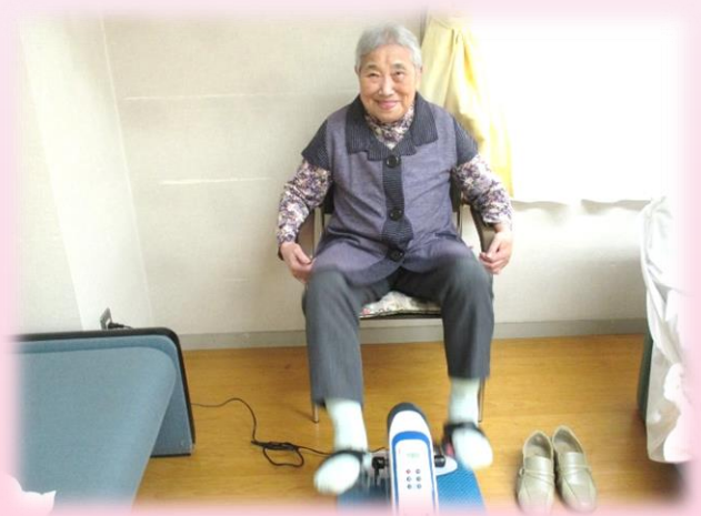
ミニバイクを使用したリハビリ