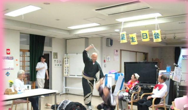
毎月の誕生日会での寸劇