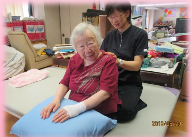
マッサージ・体操 他・・・